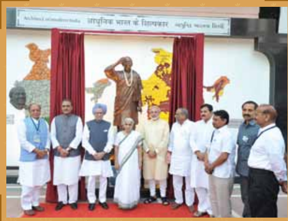
Unveiling of Sardar Statue by Hon'ble Prime Minister