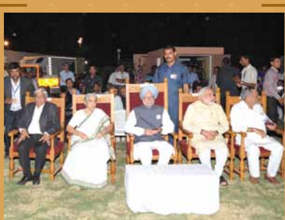
Hon'ble PM inaugurating the 3D Building projection