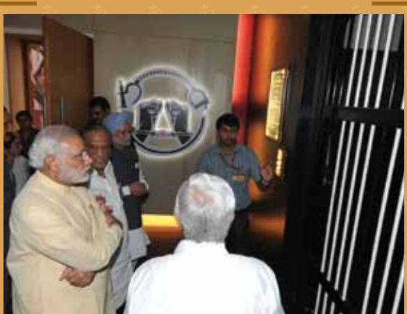
Dignitaries in Multimedia Hall 2 (MM-2)