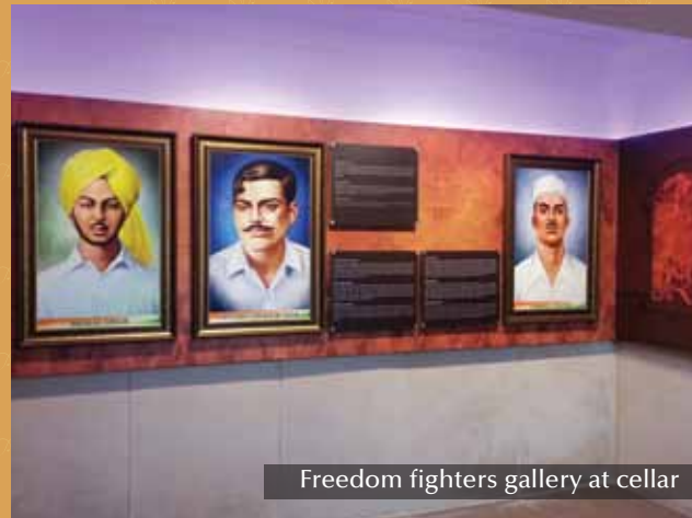
Freedom fighters gallery at cellar