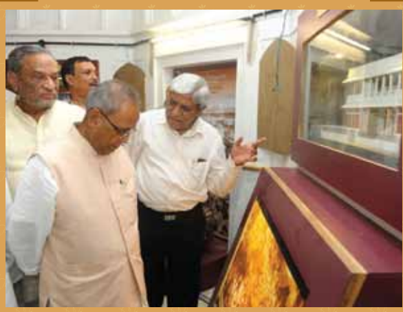
Hon'ble President Shri Pranab Mukherjee during his visit to the museum