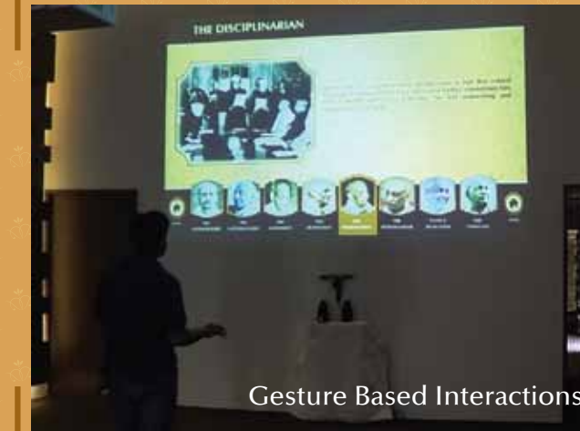
Gesture Based Interactions